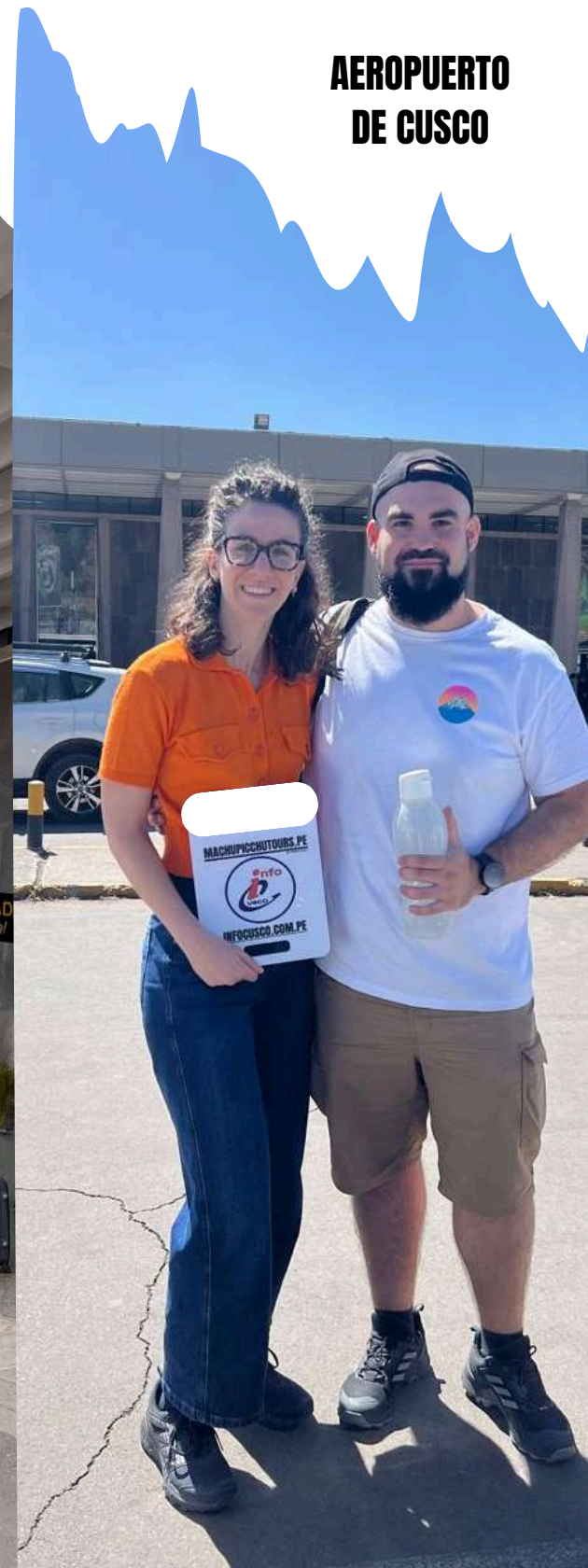
AEROPUERTO DE CUSCO