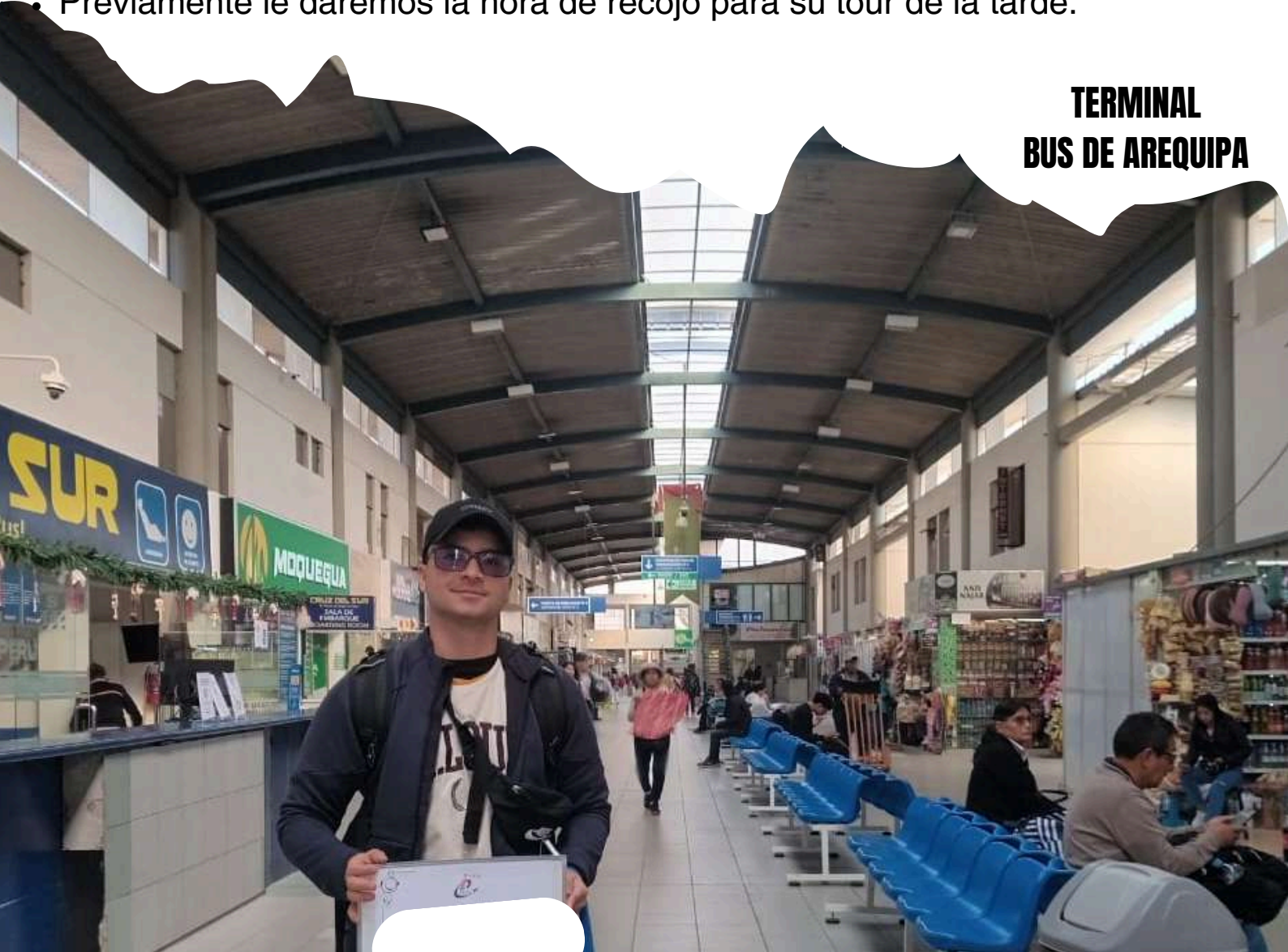
TERMINAL BUS DE AREQUIPA